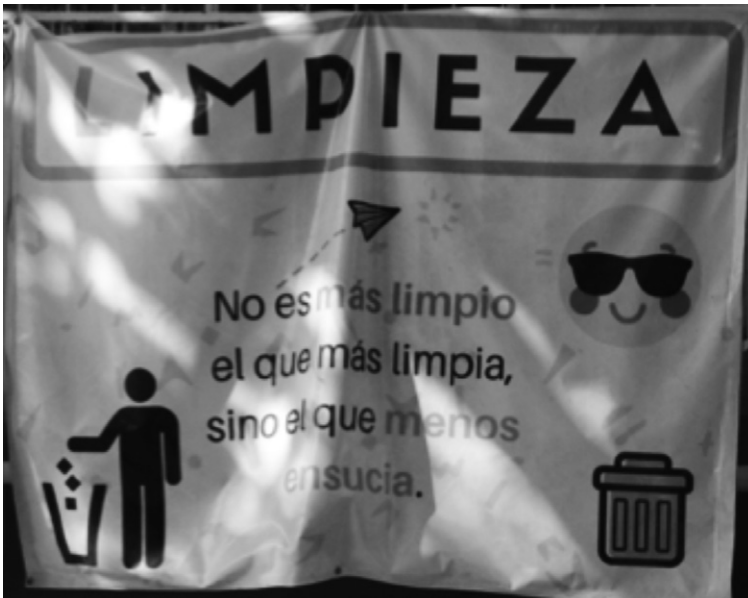
Figura 1. Ejemplo de lona proyecto valores pagada por Gabriel

La segunda manera es involucrándose en iniciativas que ayuden a mejorar el clima escolar, como el proyecto de valores desarrollado en la escuela y que él apoya incluso aportando dinero propio para materiales, por propia convicción personal y siendo honesto con sus propios principios tanto como docente, compañero y ciudadano, «Ahorita se está llevando un proyecto de valores, [...] y entonces se ponen cartulinas, yo he regalado esas cartulinas que están ahí, yo me comprometí y cada mes doy de mi dinero [...]. Porque yo sí presumo de que tengo valores, sí lo puedo presumir porque los conduzco en clase y los llevo a cabo en mi vida privada» (Gabriel #00:12:31-8#).