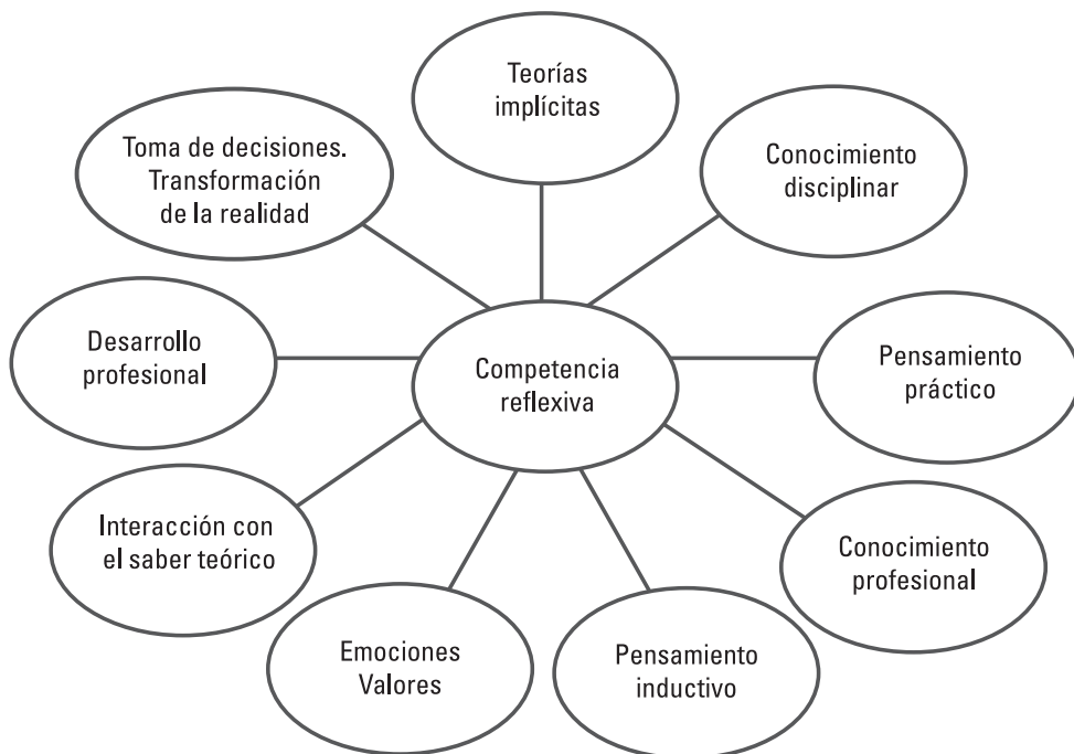
Figura 2. Implicaciones de la competencia reflexiva.