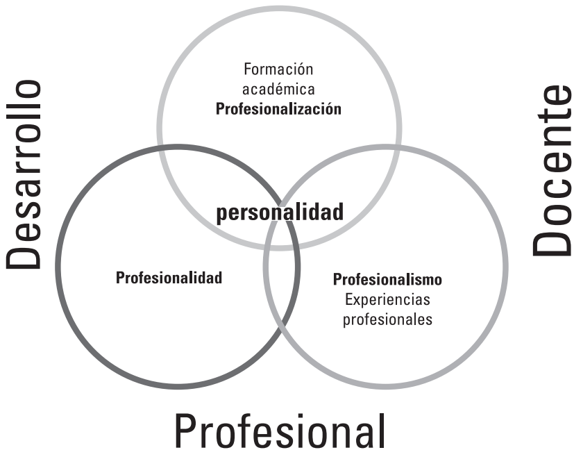
Figura 1. Desarrollo profesional docente.

Es el proceso por el cual, solo y con otros, el profesorado revisa, renueva y extiende su compromiso como agente de cambio con los fines morales de la enseñanza, y por el que adquiere y desarrolla críticamente los conocimientos, destrezas e inteligencia emocional esenciales para la reflexión, la planificación y las prácticas profesionales adecuadas con los niños, los jóvenes y los compañeros en cada fase de su vida docente (p. 17).