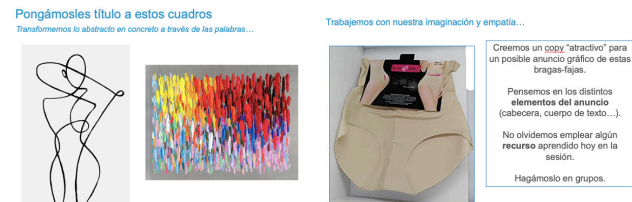
Redefinición del amor ¿Cómo se "conceptualizaría"?

RESIGNIFICANDO EL AMOR QUÉ REPRESENTA ANÁLISIS & QUE PARA HOY AMOR 2.0 INSIGHTS