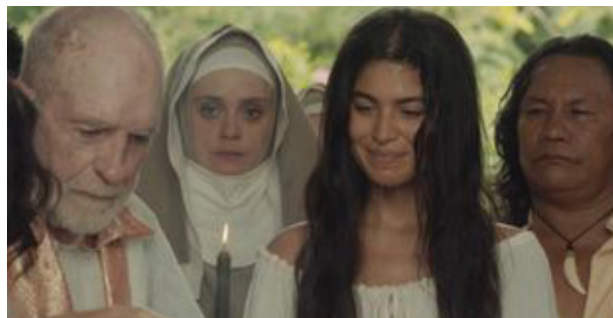
La reina de Indias y el conquistador Episodio 3. https://www.netflix.com/watch/81203775