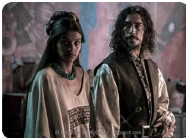
Doña Marina y Hernán Cortés en Hernán (2019).

Hernán Cortés y Pedro de Heredia 2 . En efecto, ambas indígenas nacidas y vividas en el mismo período cronológico; ambas esclavas, conocedoras de idiomas, intérpretes de ambos hombres al español; cristianizadas y renombradas y, en cierto modo, desarraigadas en parte