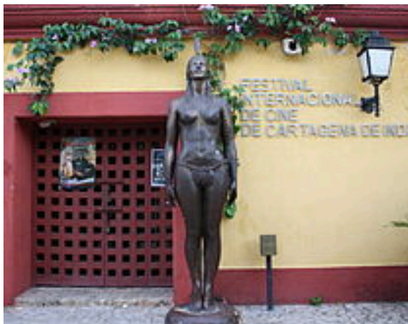
La india catalina en el Festival Internacional de cine de Cartagena.