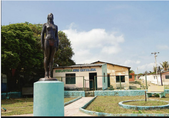
Galerazamba. Biblioteca "India Catalina"