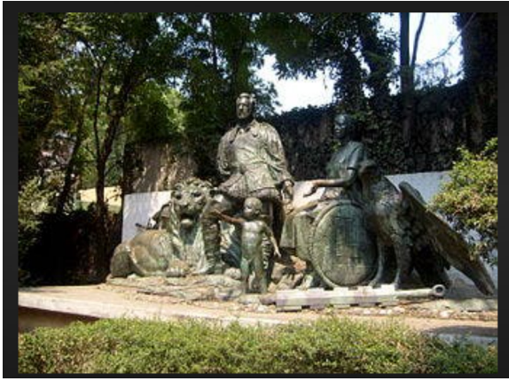
Monumento a Cortés, Doña Marina y Martín Cortés en el parque de Churubusco, Ciudad de México.