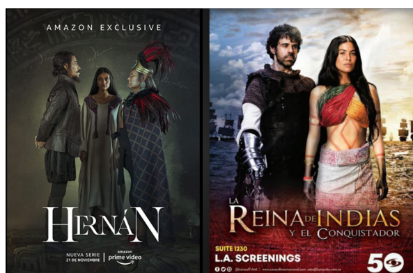
Series televisivas Hernán (2019). Trailer disponible en https://www.youtube.com/watch?v=qRII1SIVEdc y La reina de Indias y el conquistador (2020). Trailer disponible en https://www.youtube.com/watch?v=Q2wdl6BuGwE

En el presente artículo presentamos los aspectos relativos al nombre cristiano y español de ambas, así como su papel de lenguas o intérpretes de los conquistadores Cortés y de Heredia, todo ello desde la metodología de la lectura crítica y del aprovechamiento de lo multimedia que comprende el texto, la fotografía, la música y el video. Y, como base primordial de reflexión, los contenidos correspondientes en las series Hernán (TV Azteca/Amazon Prime Video, 2019) y La reina de Indias y el conquistador (Netflix, 2020).