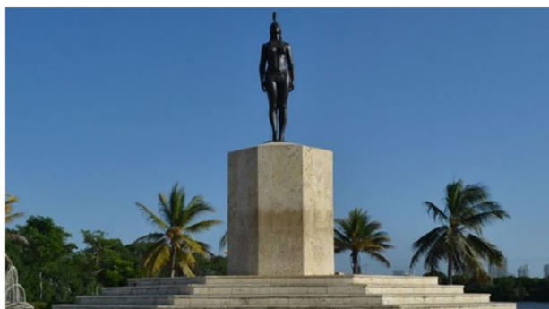
Monumento a la india Catalina en Cartagena de Indias

Esculturas de la India Catalina y Doña Marina en ciudades colombianas y mexicanas.