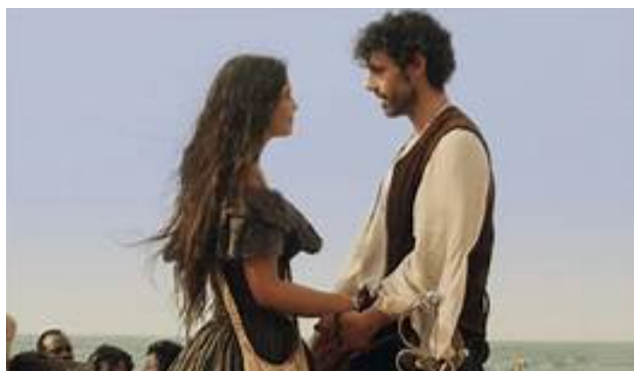
La india Catalina y Pedro de Heredia en La reina de Indias y el conquistador (2020).

Una aproximación comparativa 1 entre ambas mujeres arroja de inmediato un paralelismo evidente en sus vidas junto a dos conquistadores como