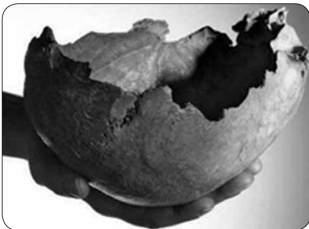
Imagen 2. "El cráneo como recipiente".

Estos cambios generarían en el hombre el inicio del sedentarismo, con avances que mejorarían su calidad de vida, y teniendo una amplia posibilidad de elementos a su disposición. Esta transición es uno de los ejemplos más claros de la evolución de la raza humana. El cristal, que actualmente se implementa en algunas elegantes mesas como utensilio para servir y tomar las bebidas, en la época primitiva del hombre se traducían en los cráneos de los animales que eran cazados y que por su forma cóncava se acoplaban a esta función ( imagen 2 ).