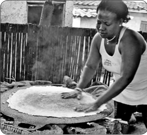
Imagen 4. "Elaboración del casabe"

respuesta a la necesidad de la tripulación que sufría escasez de alimento durante los largos viajes entre América y España.