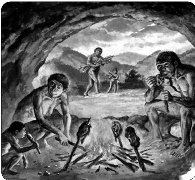
Imagen 1. “El fuego en la cocción de los alimentos”.

Con la aparición del fuego se da inicio a la nueva era del ser humano, dejando atrás el consumo de carnes crudas cuya humedad no residía precisamente en los jugos internos, resultantes