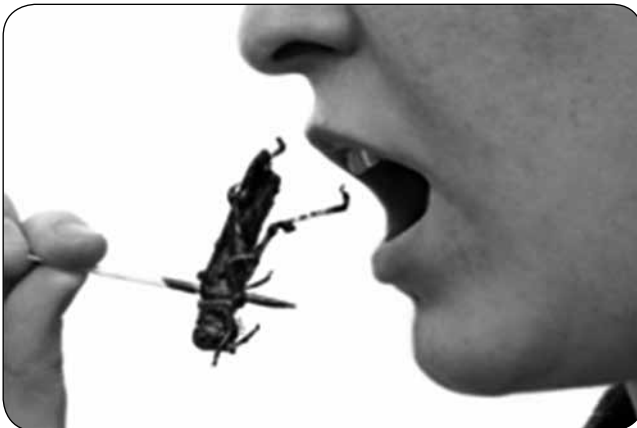
Imagen 3. "Entomofagia, consumo de insectos"

Entre la evolución del hombre primitivo al prehispánico la necesidad de supervivencia adaptó a su sistema alimentario prácticas salidas de los contextos convencionales pero que hay que mencionarlas porque forman parte de la historia de su diario vivir. El canibalismo practicado por algunos habitantes indígenas que al eliminar a su enemigo lo ingerían como si fuera un animal de caza se conoció como antropofagia; al consumo de tierra se le llamó geofagia; también se consumían excrementos secos bajo el nombre de coprofagia, e ingerían insectos, lo que se le conoce como entomofagia. Estas prácticas generaron como consecuencia graves enfermedades como la jipatera traducida como una parasitosis intestinal que a su paso cobró muchas vidas ( imagen 3 ).