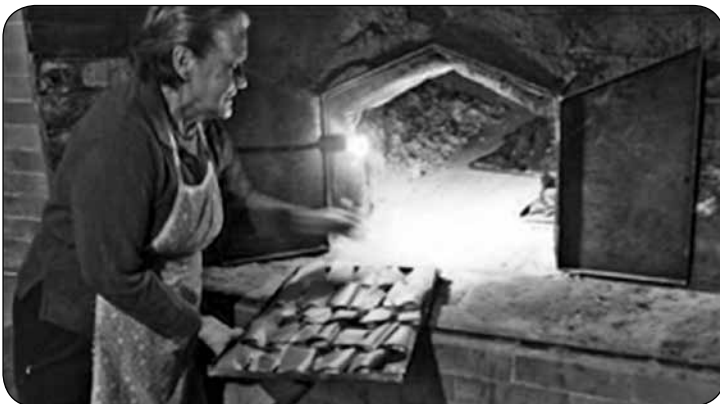
Imagen 6. “Amasijos de maíz”.

Un producto al que se le atribuyen múltiples beneficios es la chicha; los españoles no comprendían por qué en largos recorridos con los indígenas, estos al parecer tenían mejor resistencia fí-