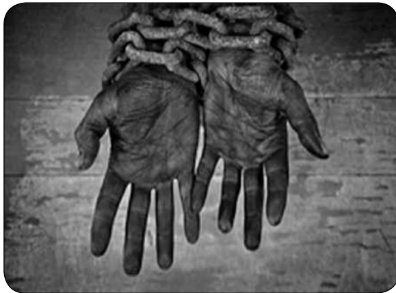
Imagen 5. “ Los esclavos africanos ”.

El español pensó en traer a la mujer negra años después con el fin de que se encargara de la preparación de sus alimentos, por la desconfianza de que los platos preparados por los indígenas fueran envenenados.