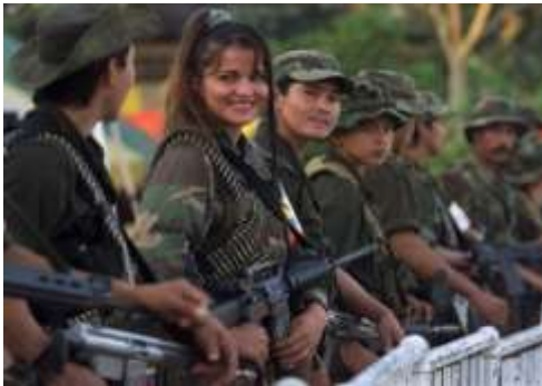
“Una guerrillera de las Fuerzas Armadas Revolucionarias de Colombia (FARC) sonríe a un compañero mientras montan vigilancia en la plaza principal de San Vicente del Caguán, donde tienen lugar las conversaciones guerrilla-Gobierno.” Enero 7, 1999.

A continuación se muestran algunas fotografías sobre el conflicto armado colombiano 204 :