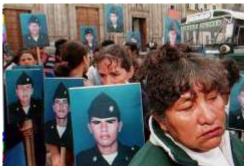
“Un grupo de madres de soldados capturados por el grupo guerrillero Fuerzas Armadas Revolucionarias Colombianas, durante una manifestación en Bogotá. Enero 13, 1997.