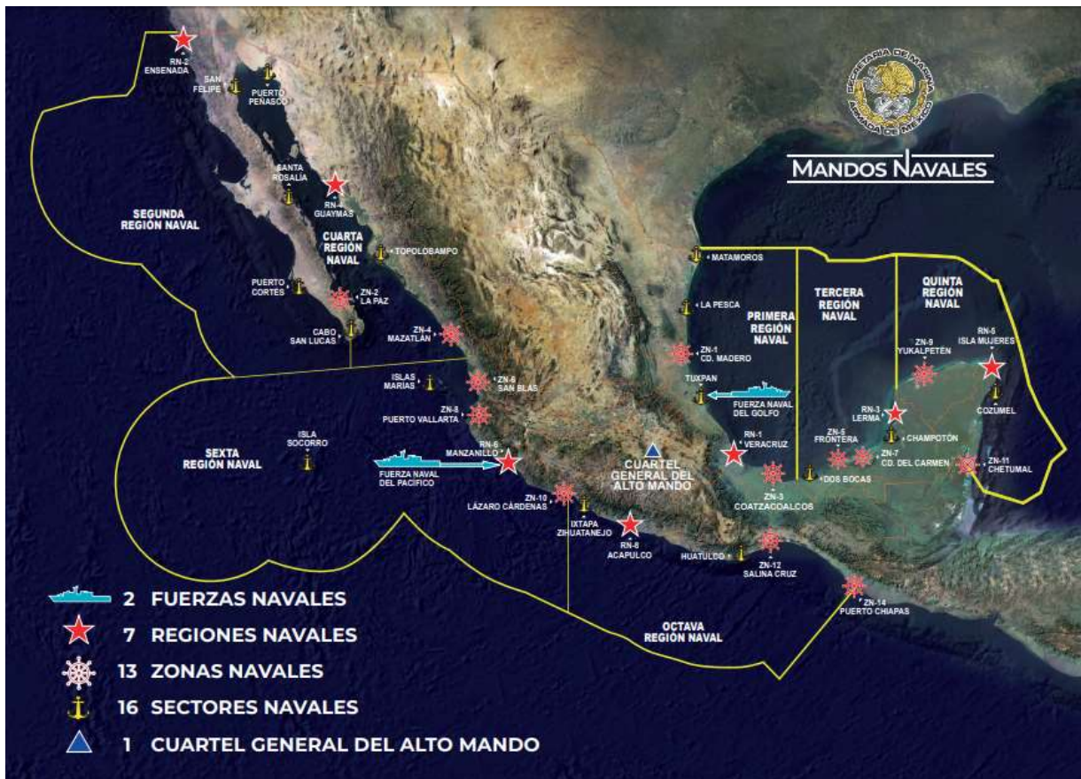
Esquema 4 . Organización Territorial de los Mandos Navales:

La formación de los abogados navales varía de acuerdo a la experiencia laboral previa al ingreso a la institución y se desempeñan en el ámbito legal que el servicio demande, incluyendo asesoría en campo a los Comandantes de operaciones de alto impacto y otras que involucran la interacción con personal civil. Dentro del Servicio de Justicia Naval, existe personal especializado en materia de Derecho Internacional de los Derechos Humanos y Derecho Internacional Humanitario, sin embargo dicha formación no permea entre la mayoría del cuerpo de abogados, lo cual representa un campo de oportunidad para homologar criterios de asesoría y asistencia legal.