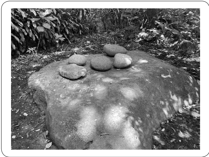
Figura2. “Tumba de Moler”, en la comunidad de Guanacaste. Ujarrás, Buenos Aires.