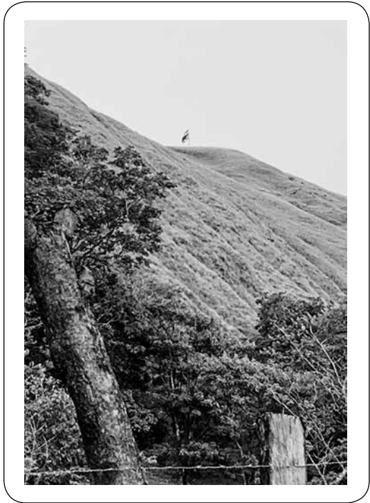
Figura 4. Vista de parte de la Sabana Oka, desde Oka ñak, en Guanacaste de Ujarrás, Buenos Aires.

puede ser un puente entre el Atlántico y el Pacífico, utilizado por varios grupos originarios. Esta ruta era recorrida para buscar nuevas tierras y también funcionaba como vía de intercambio entre las comunidades de la cordillera.