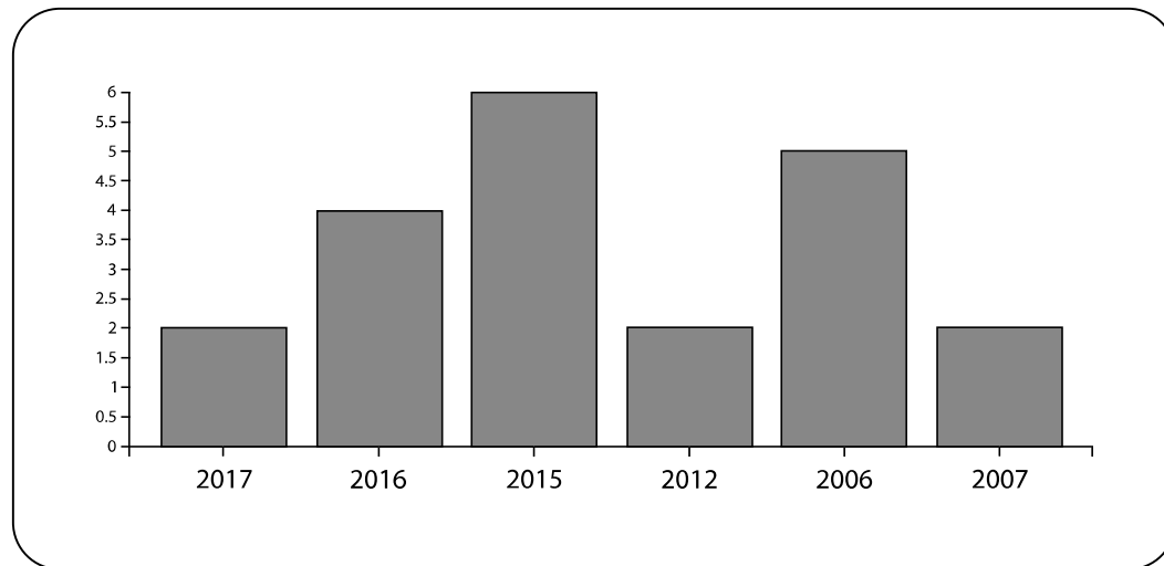
Figura 1. Años con mayor producción de artículos.