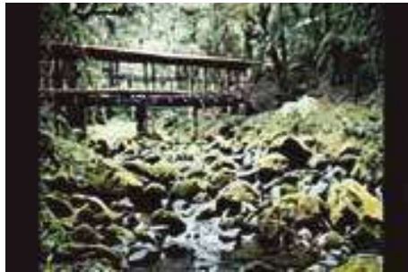
Instalaciones del Parque Ecoturístico "La Venta".