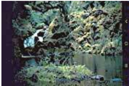
Parque Ecoturístico "La Venta".