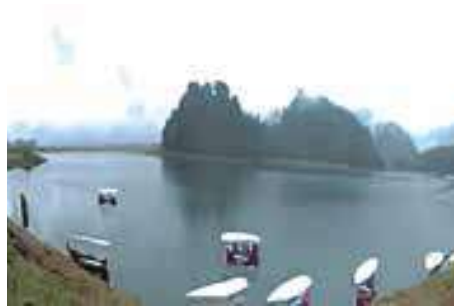
Actividades recreativas en la Presa Tenango.