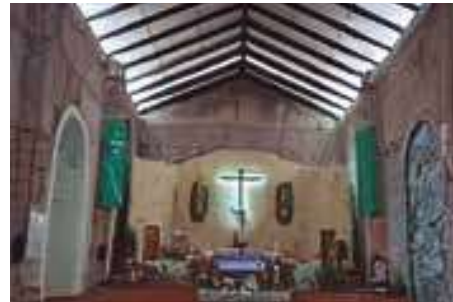
Santuario del Señor en su Santo Entierro.