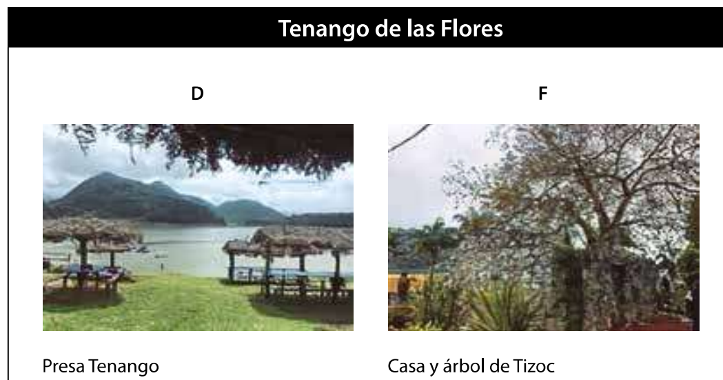
Tabla 3. Fotografías seleccionadas para la valoración.

viamente investigadas. La selección de los paisajes y fotografías se realizó a través de la observación directa con la aplicación de fichas de observación. Al final del proceso, se incluyeron un total de diez fotografías, número determinado por conveniencia para mantener el interés del entrevistado, para la valoración de atributos estéticos del paisaje combinando paisajes con elementos naturales y culturales (Tabla 3).