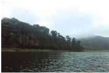
Bosque de niebla.